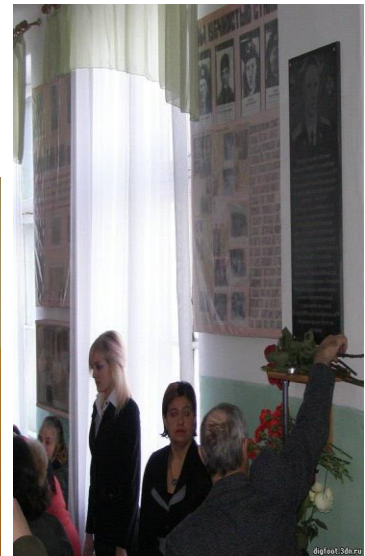
Открытие мемориальной плиты в Целинной средней школе №2 - в 2010 году .